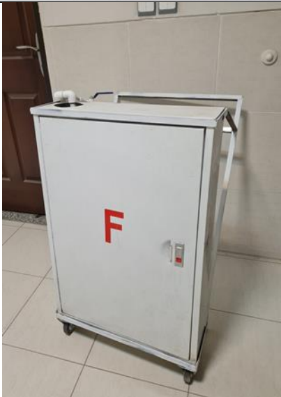
فایر باکس پورتابل