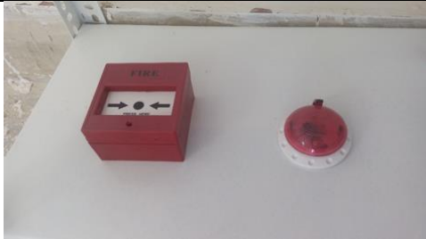
شستی اعلام حریق